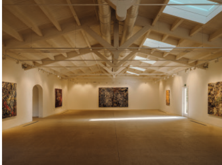
'Mark Bradford. Masses and Movements' is the inaugural exhibition at Hauser & Wirth Menorca, on view until October 31 © Mark Bradford.

ried out with great care, preserving as many of the original beams and other materials as possible. "For me, the most interesting challenge was discovering the place, understanding its personality. It's loaded with history, and that should be showcased rather than denied".