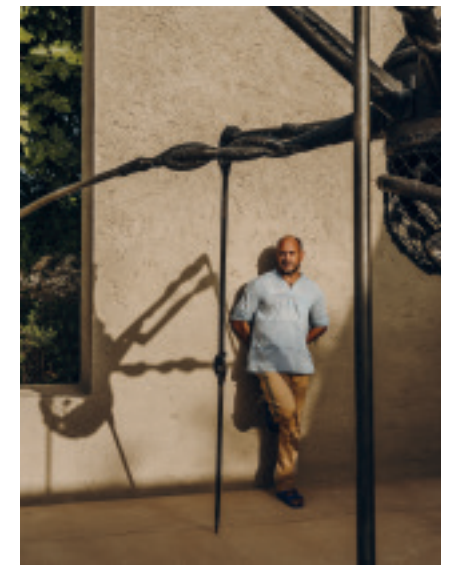
Luis Laplace and the Louise Bourgeois Spider @ The Easton Foundation / Licensed by VEGAP, Barcelona 2021