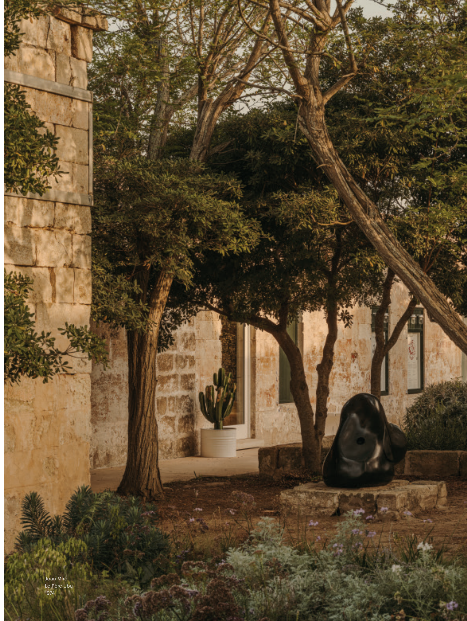
Joan Miró Le Père Ubu 1974