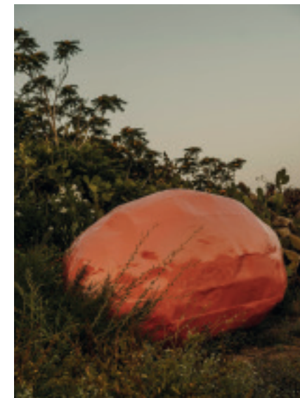
Franz West Autostat, 1996