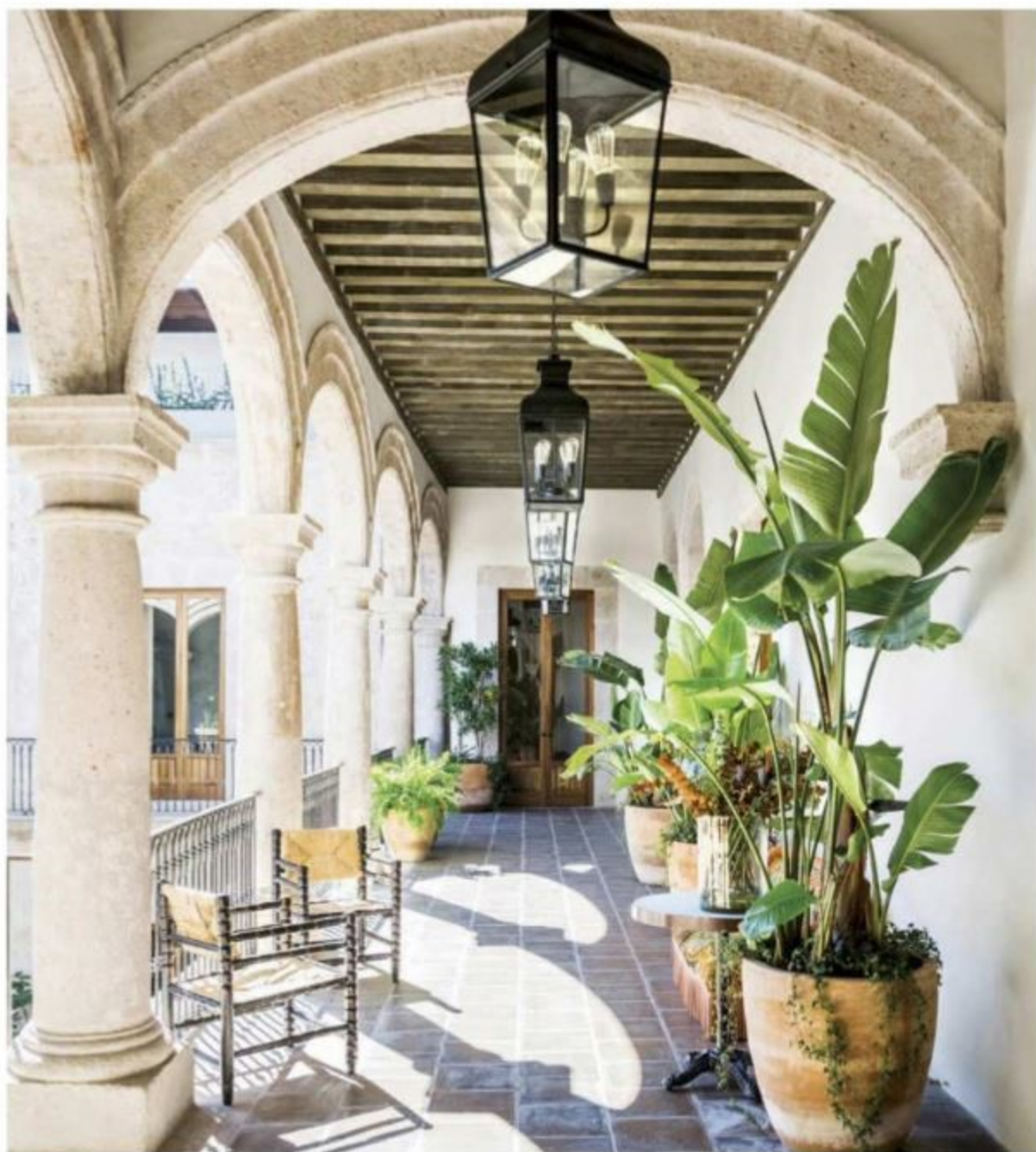
En el patio, un par de sillones en madera de nogal y paja de Laplace Antiques.