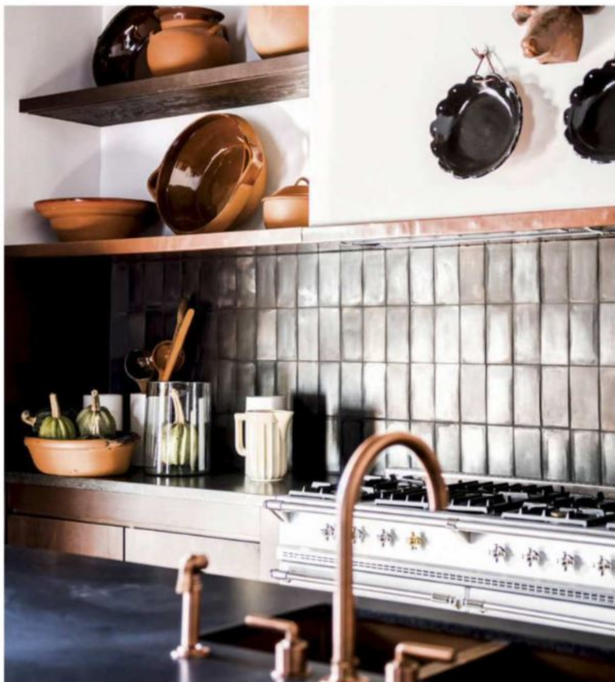
En la cocina, horno de Lacancho. Cazuelas del Instituto del Artesano Michoacano, Azulejos de Colectivo 1050°.